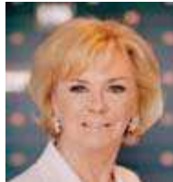
Liz Mohn Presidenta